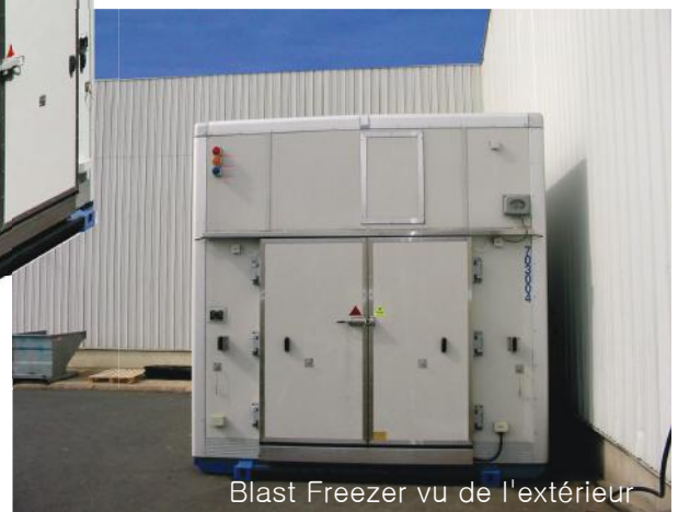
Blast Freezer vu de l'extérieur

Système de monitoring et d'enregistrement du fonctionnement du module