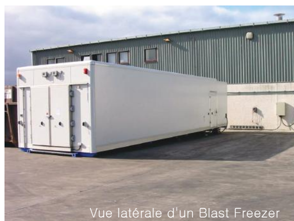
Vue latérale d'un Blast Freezer