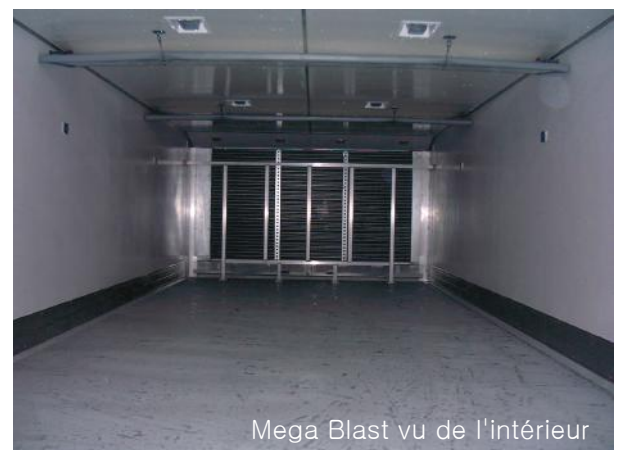
Mega Blast vu de l'intérieur