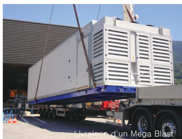
Livraison d'un Mega Blast